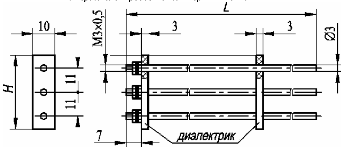
Модель ДУ.3, 3 электрода, H – 34мм, L – 0,5; 1; 1,95 м

ПРИМЕЧАНИЕ. Материал электродов – сталь нерж. 12Х18Н10Т